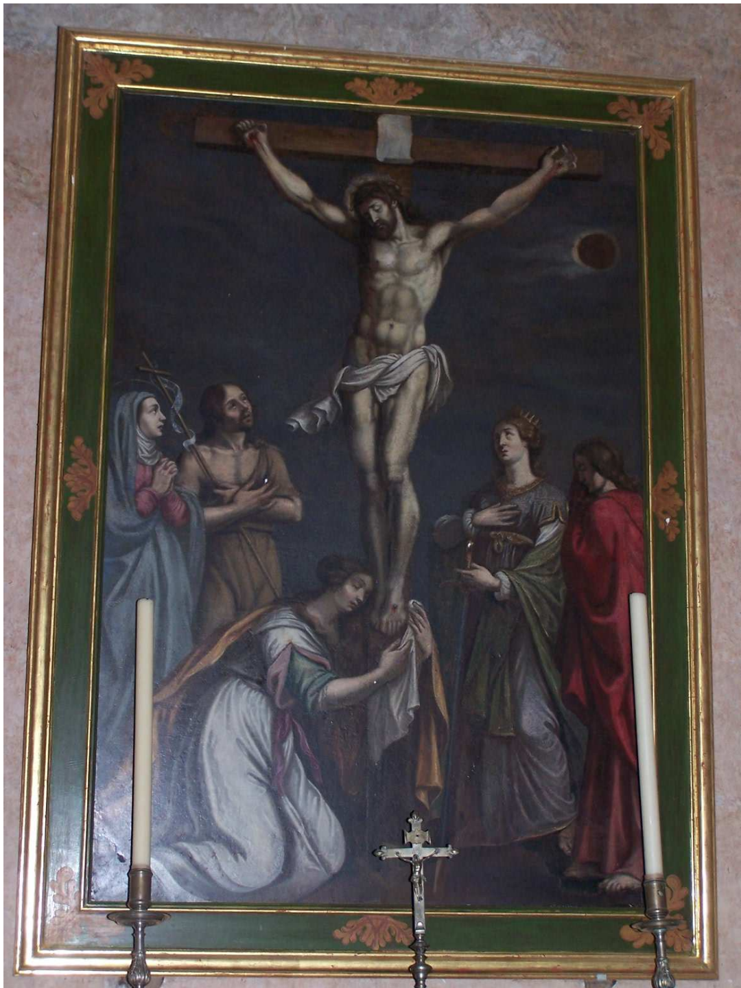
Le tableau de La Crucifixion appendu dans l'église montre une éclipse de lune et le titulus est vierge de l'inscription I.N.R.I. habituellement écrite.